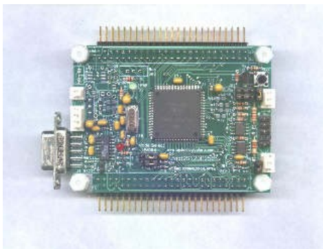
בקר MC9S12DP256 מחברת Technological Arts